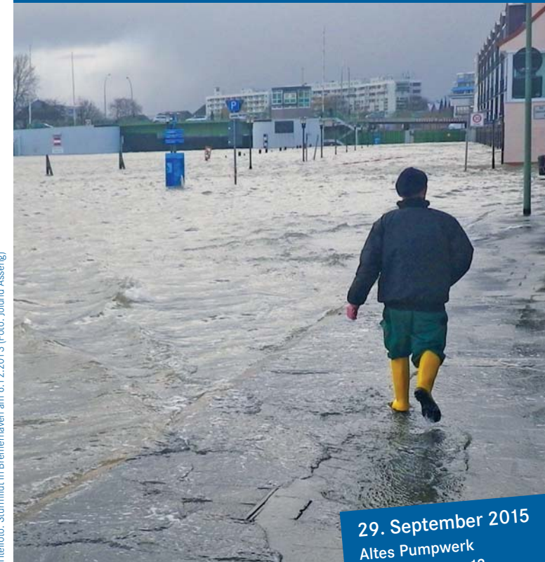
Tiefenfoto: Sturmflut in Bremerhaven am 6.12.2013

5. REKLIM Konferenz „Klimawandel in Regionen“